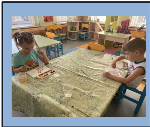
Рисование «Птичка на ветке»